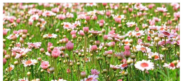
Laat alle bloemen bloeien

De Initiatiefgroep richt zich er nadrukkelijk op dat de bewoners van Dieren NW zelf activiteiten gaan ontwikkelen die hun buurtgemeenschap(je) ten goede komen. (een bij uitstek 'bottom up' aanpak) De latente bereidheid om iets te doen moet in - de volle breedte van - de wijk worden onderkend en worden losgemaakt.